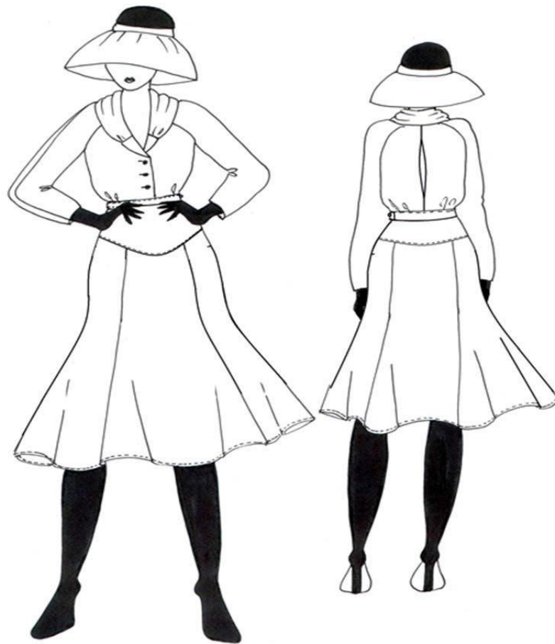
Рис. 1 – Рисунок модели костюма