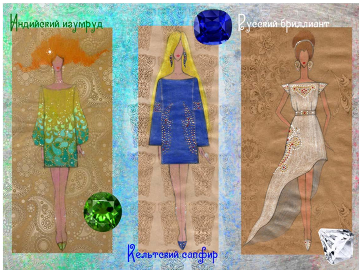
Рисунок 3 – Эскизы моделей. Автор Кузнецова Алина. 2013 г.