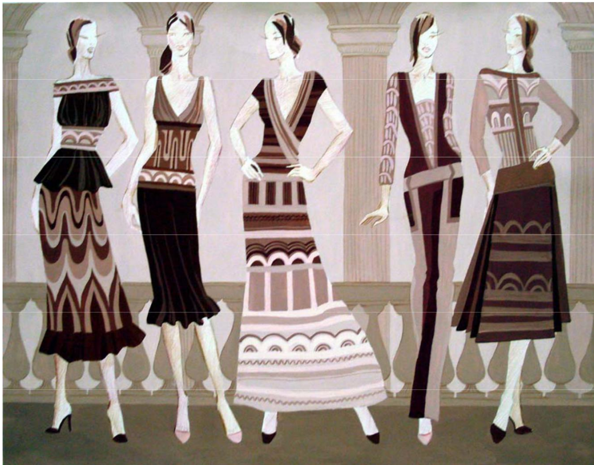
Рисунок 1 – Разработка коллекции из трикотажа «АрхиТрик». Автор Дьячкова Татьяна